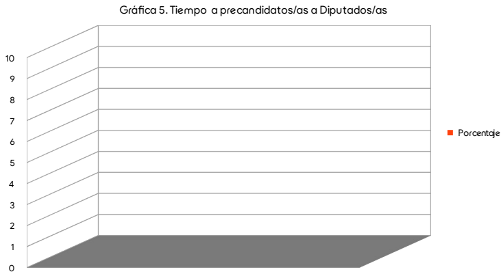
Tabla 3. Tiempo, porcentaje y menciones en radio y televisión por precandidato(a) A Diputados para el Congreso